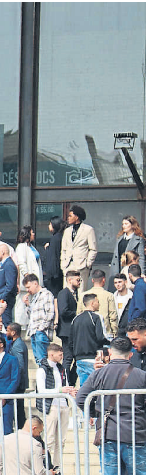
AINA MARTÍ / ACN

mismos ya ponen a gente muy joven en primera línea, lo que no deja de ser un estímulo”, arguye Perlado.